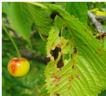
Budapest, 2023. május 25.

► Az előző felhívásban írtam a cseresznyelég megjelenését jelző ragacsos sárgalapokról. A talajból kibújó legyek először a fa tetején lévő termést keresik fel. Ha a sárgalapokat a fa tetejére tudják kiakasztani, akkor már ezeket a legkorábban kikelő legyeket is elcsíphetik és időben kezdhetik a permetezést. A csalomoncsapdákat forgalmazó kutatóintézet egy könnyen kezelhető akasztót fejlesztett ki, mely a webáruházukban megvásárolható. A diófán is így kell használni, mert a dióburoklég is a lombkorona tetején, a déli oldalán jelenik meg először.