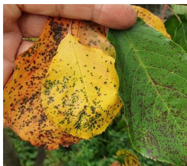
Jó egészséget, jó kertészkedést: